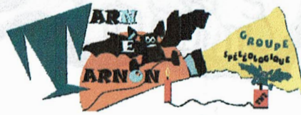
Groupe spéléo Tarn né Tarnon