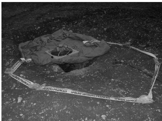
Photographie 1 : dispositif de soufflage utilisé.

Tous les tirs ont été effectués dans une même cavité (le puy de Capy), avec une ventilation artificielle continue par soufflage d'air frais en entrée de la cavité ( photographie 1 ).