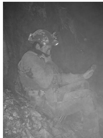
Photographie 2 : conditions « difficiles » pour la mesure du CO !

Ce type de ventilation « poussante » permet de faire retomber très rapidement le teneur en CO à des seuils inférieurs à 100ppm en quelques minutes, lors de volées importantes.